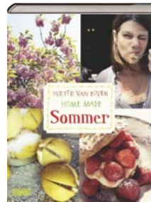
Yvette Van Boven Home Made Sommer Dumont Verlag 29,95 €