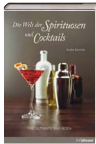
André Dominé Die Welt der Spirituosen und Cocktails H.F. Ullmann Publishing 29,99 €